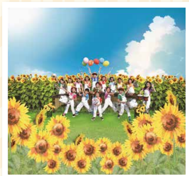
広島ジュニアマリンバアンサンブル